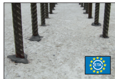
Bewehrungsanschlüsse Reinforcement connections