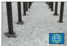
Bewehrungsanschlüsse Reinforcement connections